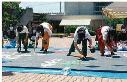
書道パフォーマンス